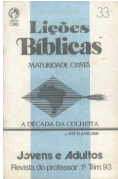
Lição Bíblica divulga a Década da Colheita

Mesmo tais metas não tendo sido alcançadas naquele momento é inegável a contribuição do projeto para a evangelização nacional, aliás, o último e grande projeto nacional da denominação;