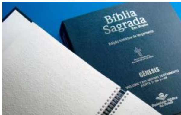
Bíblia em braile - SBB

4) Você não viu um avivamento quando a SBB lançou a Bíblia em braile em 2002. Um contingente de mais de 500.000 pessoas pode, desde então, ter acesso à Palavra de Deus nesse formato. Somente no segundo semestre de 2020 foram distribuídas, gratuitamente, 15.000 exemplares da Bíblia para deficientes visuais em todo o Brasil;